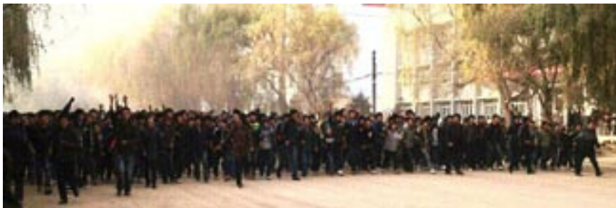
▲ Flere tusen skolebarn protesterte i Rebkong