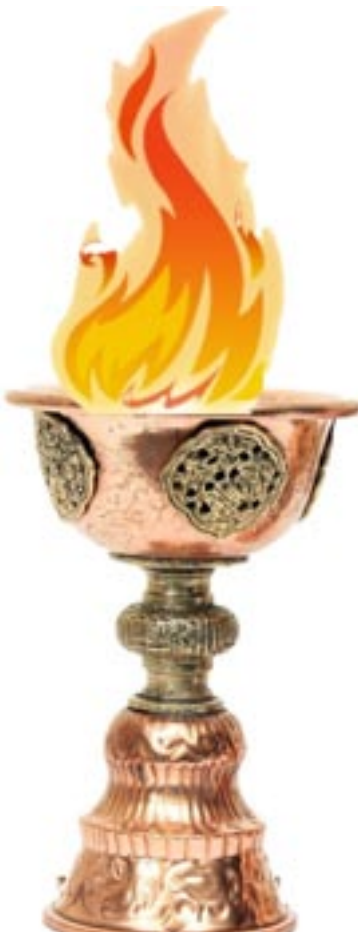
▲ “Sannhetens fakkel”. Fakkelstafetten endte i New York den 10. desember 2012 etter å ha samlet inn 350 000 underskrifter.

En liten demonstrasjon kan lukke hele Tibet fra resten av verden. I Tibets hovedstad Lhasa ble det i 2008, i forbindelse med de Olympiske leker, holdt en demonstrasjon, og hele Tibet ble stengt fra omverdenen. Siden 2011 har tibetanere aktivt drevet med selvtenning. Det har nesten blitt helt forbudt å besøke Tibet og kommunikasjon med telefon er nesten umulig. Sivilkledd politi og militæret er økt, hvor hovedstaden Lhasa ser