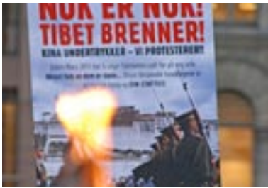
Tibet brenner Side 8-13