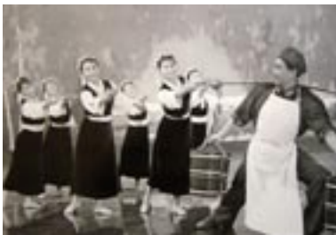
Kultur og utdanning Side 14-26