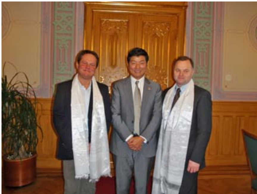
▲Lobsang Sangay møter Stortingets Tibet-komité ved Ulf Erik Knudsen (til høyre) og Olemic Thommesen (til venstre)

Sangay uttrykte også en enorm taknemlighet for alt den eldre generasjonen tibetanere har utrettet, og at det nå er hans tur, som ung og velutdannet tibetaner, til å stille opp