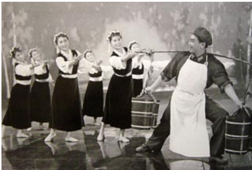
▲ Framføring av klesvaskesangen i Beijing i 1975

Påvirkningen er spesielt farlig for den nye generasjonen tibetanere som ikke har erfart grusomhetene under den kinesiske invasjon og okkupasjon i Tibet i 1950-årene eller Kulturrevolusjonens daglige redsler. De blir fremdeles kontinuerlig bombardert med kommunistpartiets versjon av historien. De ser Mao som en velgjørende leder som forente Kina og "frigjorde" Tibet fra "føydalherrene". Jeg har hatt noen smertefulle og opphetede debatter med venner som nylig har flyktet fra Tibet. De klandrer tibetanske aristokrater og klostersonner for å lede en sosial orden så korrumpert og undertrykkende at det på en måte berettiger en