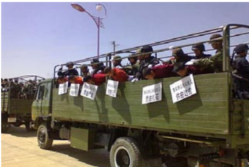
▼ Fangene holdes fram på utstilling i det de føres bort

Artikkelen er oversatt fra kinesisk til engelsk av Paul Mooney. Oversatt fra engelsk til norsk av Bodil Fremstad.