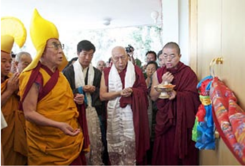
▲ Dalai Lama innvier regjeringsbygget (Kashag-sekretariatet)