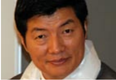
Ny leder Side 4-7