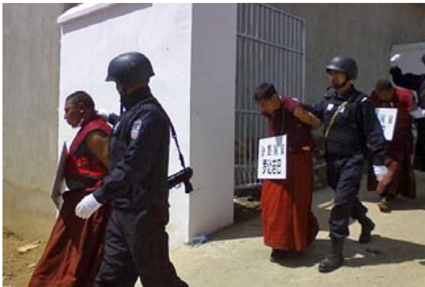
▲ Munker ledes bort med plakater rundt halsen som beskriver deres forbrytelse

Den kinesiske regjeringen frykter at tibetanere som ofrer livene sine vil inspirere de levende til å gjøre motstand. Men uansett hvordan de for-