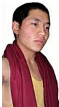
▲ Phuntsog, Kirti kloster, Ngaba

”Politi, mange av dem med opprørskjold, batonger og lenker, var oppstilt i byens gater... Store grupper