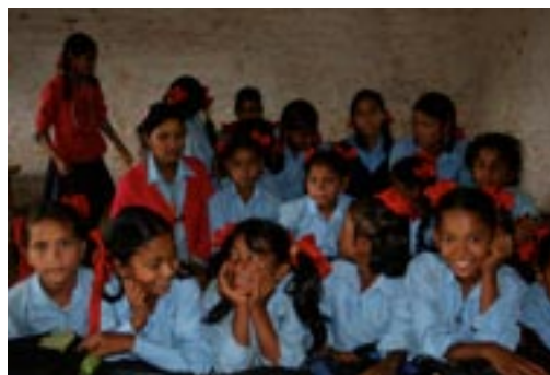
▲ Shenpen India

Karma Tashi Ling buddhistsamfunn har opprettet Shenpen , en underorganisasjon som har som målsetting å kunne bidra til å avhjelpe tibetanske flyktningers lidelser i bl.a. India og Nepal.