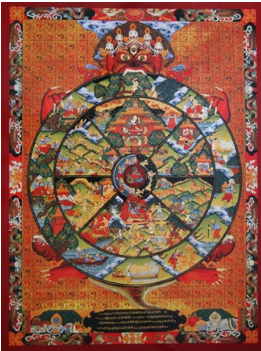
▲ En thanka , det tibetanske "Livets Hjul"

stendighetene rundt ens neste liv er direkte avhengig av de valgene man har tatt i sine forrige liv.