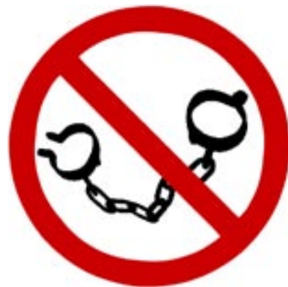
▲ Illustrasjon: Av ПOKA ТУТ via Wikimedia Commons

Det er lettere å se dette i praksis: Det er faktisk ingenting i veien for at en person eller regjering kan støtte eller akseptere autonomi nå, og hvis au-