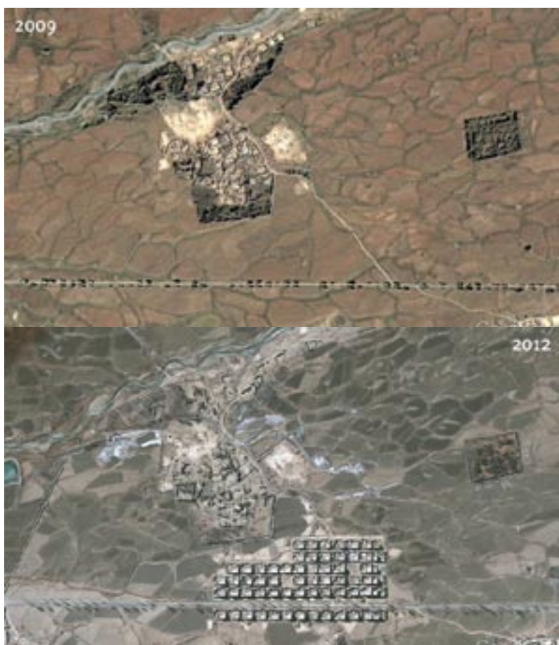
▲ Drupshe (Xiezhawo) før og etter

http://www.hrw.org/news/2013/06/27/china-end-involuntary-rehousing-relocation-tibetans